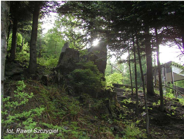
fol. Paweł Szczygieł